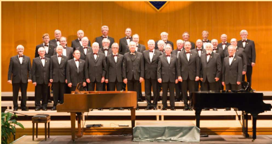
MGV Eintracht 1878 Stukenbrock mit seinen Solisten des Abends